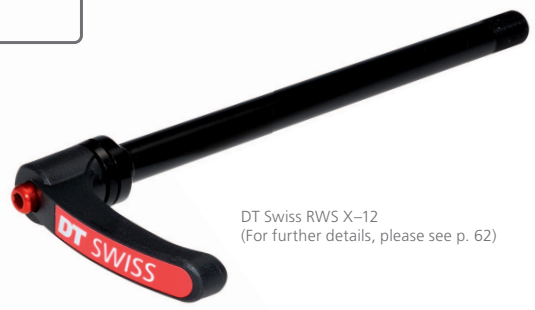
DT Swiss RWS X-12 (For further details, please see p. 62)