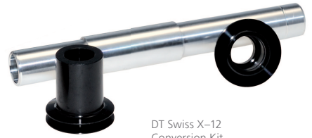
DT Swiss X-12 Conversion Kit