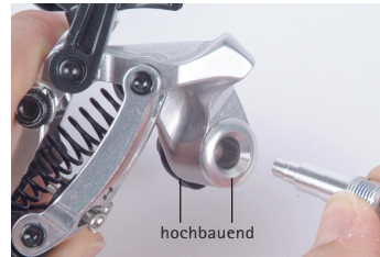
Pin für SRAM hochbauend