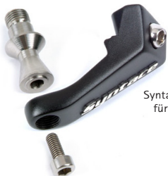
Syntace RockGuard II für Shimano Saint