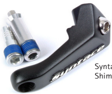
Syntace RockGuard II für Shimano Standard und Shadow