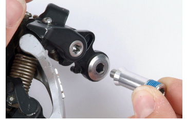
Pin für Shimano Shadow