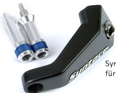
Syntace RockGuard II für SRAM