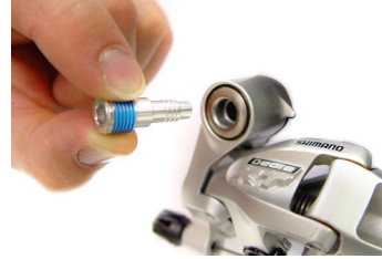
Pin für Shimano Standard

Im Lieferumfang sind je nach RockGuard-Variante unterschiedliche Pins enthalten. Prüfen Sie zuerst, welcher Pin am Besten in die Befestigungsschraube Ihres Schaltwerks passt.