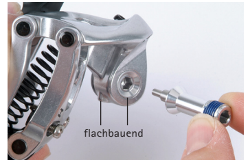
Pin für SRAM flachbauend