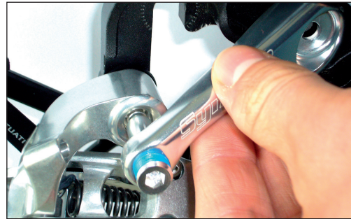
Syntace RockGuard® 301

Stecken Sie nun die mitgelieferte M6 Schraube, bei den Modellen 301 ab Serie Mk 2, in das vordere Befestigungsloch des RockGuards und ziehen Sie die Schraube mit der mitgelieferten M6 Mutter mit 10 Nm fest. Bei den Modellen 101 und 101 four cross ist der RockGuard mittels der Schraube mit 10 Nm an der dafür vorgesehenen Aufnahme des Ausfallendes zu befestigen.