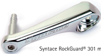
Syntace RockGuard® 301 mit Pin B

Der Syntace RockGuard® macht dadurch erstmals ein einfaches Schaltauge zu einem echten 3-D Schaltauge. Das ohnehin schon sehr steife und stabile Schaltauge an allen Liteville Rahmen gewinnt dadurch enorm an Steifigkeit und Schaltpräzision. Außerdem vermindert der Syntace RockGuard® nochmals erheblich die Gefahr eines verbogenen Schaltauges.