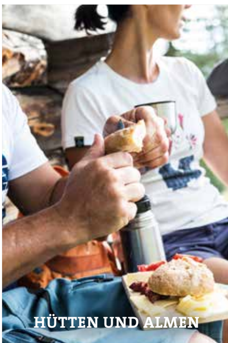
HÜTTEN UND ALMEN